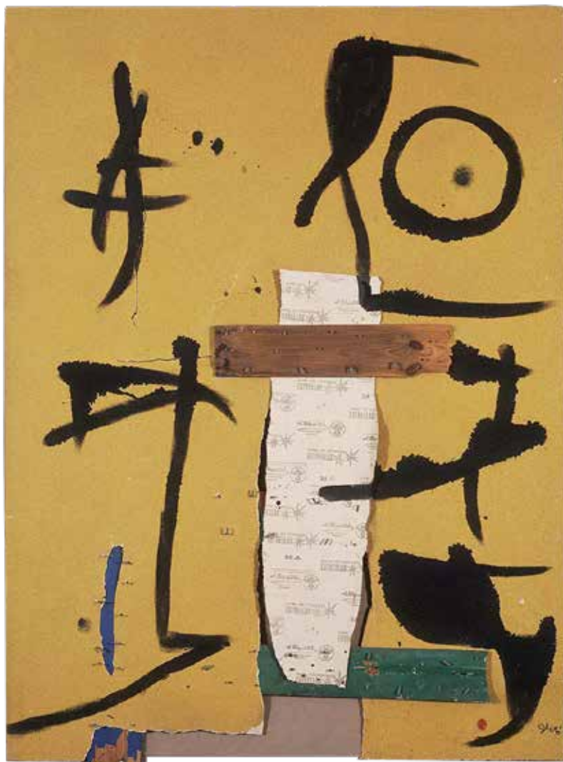
Joan Miró. Personnage, oiseaux , 1976. Oli damunt paper de vidre, fusta i claus

Personnage, oiseaux (1976), l'obra amb la qual s'inicia el recorregut per l'Espai Estrella, és tal vegada la pintura més destacada de la col·lecció de la Fundació Pilar i Joan Miró a Mallorca. Està feta amb oli damunt paper de vidre de color groc, amb trossos de fusta i claus, i està relacionada amb les construccions de l'artista dels anys 30. Més que voler representar el personatge i els ocells del títol de l'obra, sembla construir un espai autònom en el qual el llenguatge és tan important com el tema.