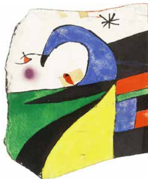
Joan Miró. Maqueta per a Gaudí I , c. 1975. Gouache, tinta, llapis de grafit, pastel i collage damunt paper