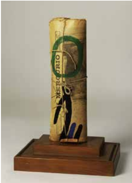
Joan Miró. Sense títol, 1972. Paper de diari, gouache, tinta, cordill, fusta i filferro