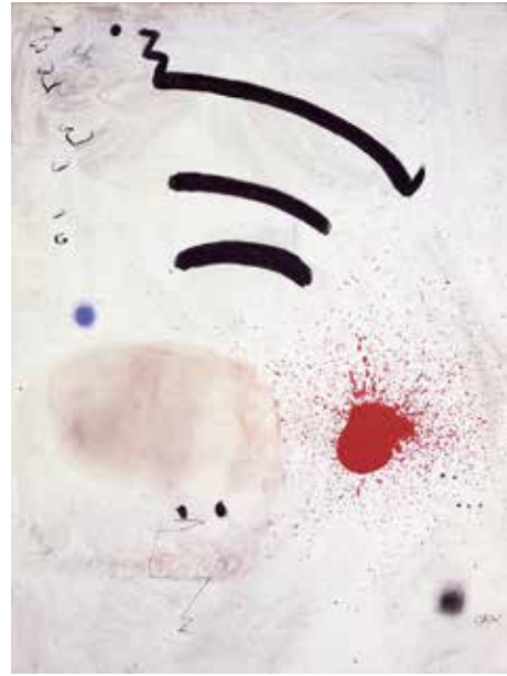
Joan Miró. L'éveil du matin , 1974 Oli damunt tela Dipòsit col·lecció particular

L'exposició finalitza amb una selecció de pintures acabades. A les darreres dècades de la seva vida Miró s'obsessiona amb uns pocs temes: dones, personatges, ocells i astres. No obstant això, el seu afany experimentador no desapareix, com ho palesen les seves pintures lacerades o foradades, de les quals es mostren diversos exemples de principis dels setanta. En aquesta època pintarà també damunt quadres comprats a mercats ambulants, com Personnages, oiseau, étoile, paysage de Palma (1973). Altres temes tractats per Miró són els paisatges, com a Paysage (1974), en què la terra és de color vermell, i L'Odeur de la prairie (1973), un paisatge replet de petits incidents pictòrics. També pinta ballarines, com Danseuse (1969), i aquest és un altre tema freqüent en la seva obra. Aquí veiem un cercle blanc central damunt un fons blau, que suggereix un ball nocturn durant una lluna plena. Una altra pintura destacable és L'éveil du matin (1974), sobre la sortida del sol. Miró explora de manera simultània el que té més pròxim en el món rural i els distants espais insondables del cosmos.