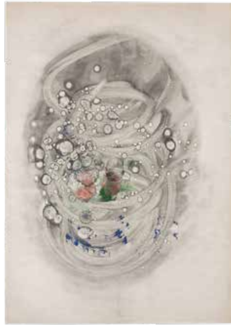
Joan Miró. Sense títol, sense data. Monotip damunt paper