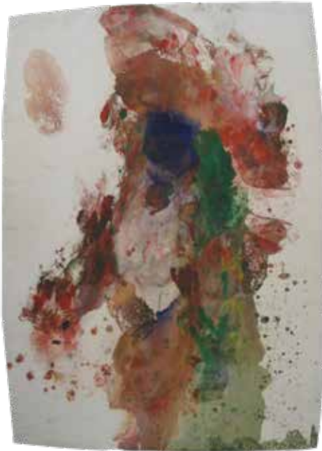
Joan Miró. Sense títol, sense data. Monotip damunt paper