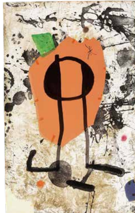
Joan Miró. Bon à tirer per a Fundació Palma II , 1978. Tinta, gouache, pastel, aiguafort i aiguatinta damunt paper