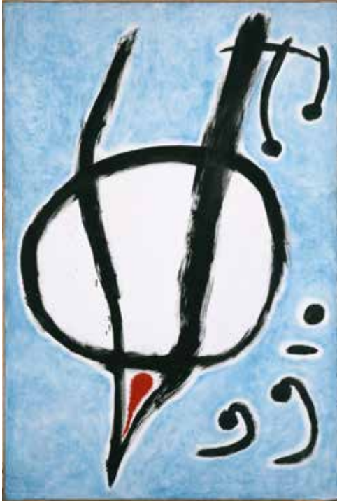
Joan Miró. Danseuse , 1969. Oli damunt tela. Dipòsit col·lecció particular