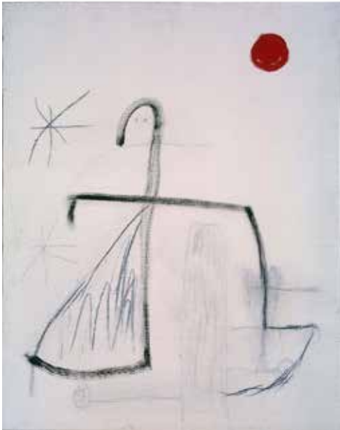
Joan Miró. Sense títol, 1978. Oli i carbonet damunt tela